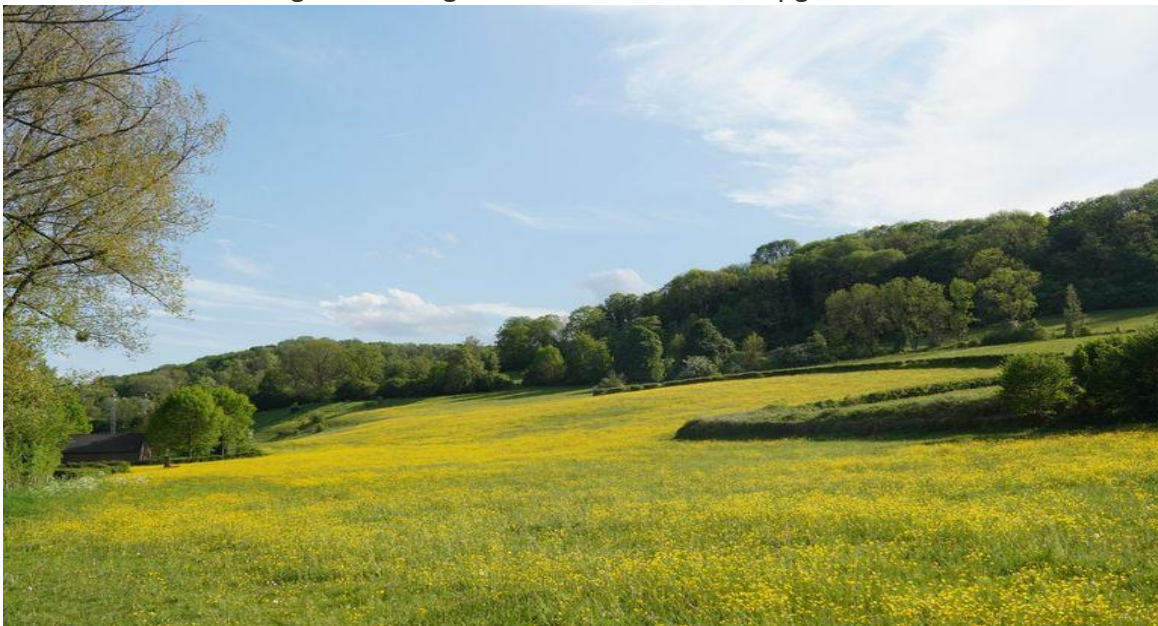
Een extensief beheerd weiland met een hoge bloemrijkdom in Zuid-Limburg

Dus hoe kunnen we het aantal bloemen in de zomer verhogen? Het aanplanten van bloemenstroken ziet er leuk uit en kan bijen ten goede komen, maar in de praktijk bedekken ze maar een heel klein deel van het landschap en bevatten ze geregeld niet-inheemse planten. De beste manier om later in het seizoen meer bloemen te krijgen, is door het maaibeheer van graslanden en wegbermen aan te passen. Dit kan door het invoeren van gefaseerd maaien of gefaseerd begrazen, zodat er altijd bloemen beschikbaar zijn, en door het maaien en afvoeren in plaats van klepelen. Daarnaast kunnen bloeiende planten zoals klavers, luzerne of kruidenmengsels in het graslandbeheer worden opgenomen om het bloemaanbod te vergroten.